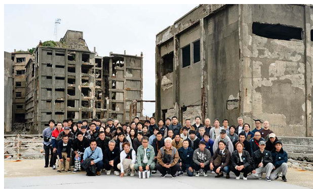
佐賀・長崎:社員研修慰安旅行(2025年)