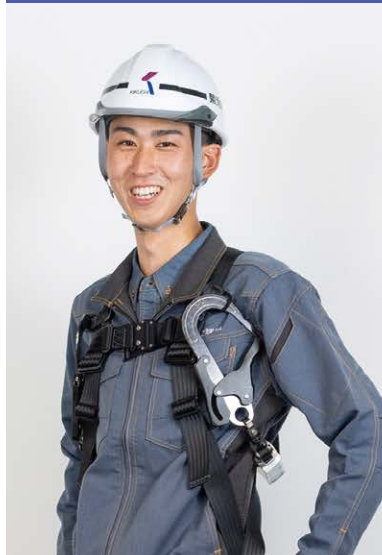
社内環境・教育制度